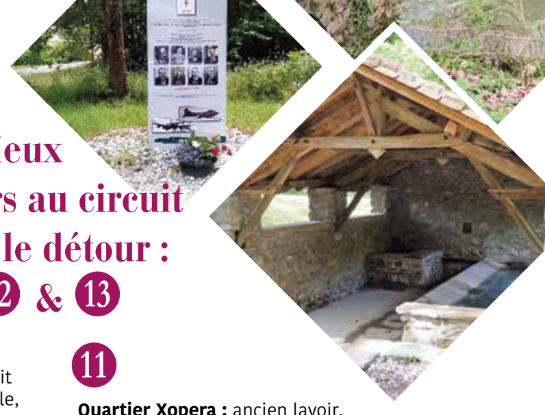
11 Quartier Xopera : ancien lavoir, pont du Diable, lieu de passage du réseau Comète. Cimetière militaire (14/18) : sur CD 932. Maison Ospitalia : ancien accueil des pèlerins de St Jacques de Compostelle.