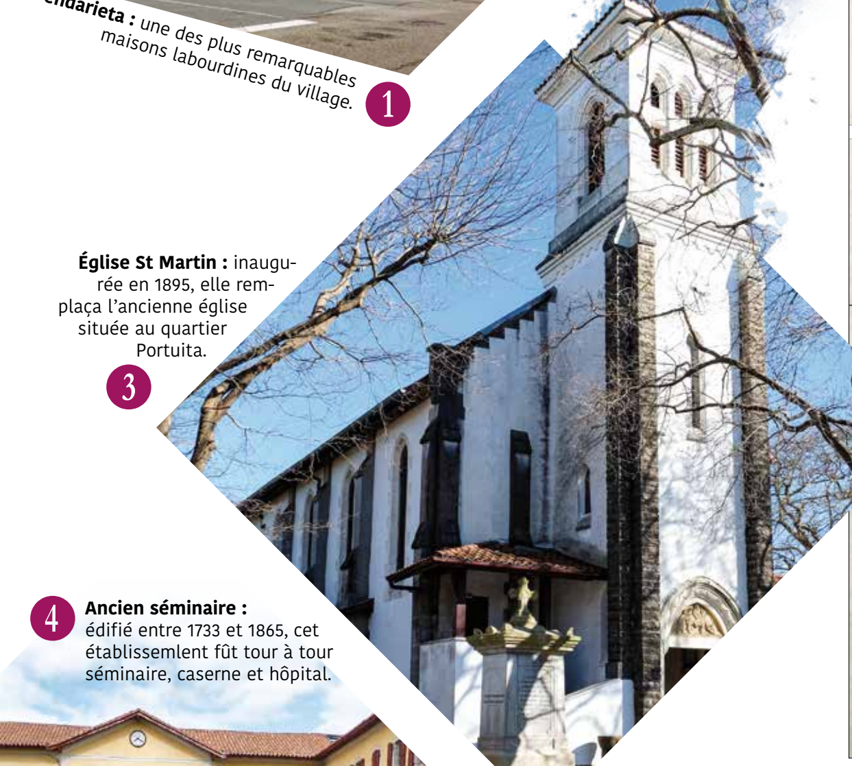
3 Église St Martin : inaugurée en 1895, elle remplaça l'ancienne église située au quartier Portuita.