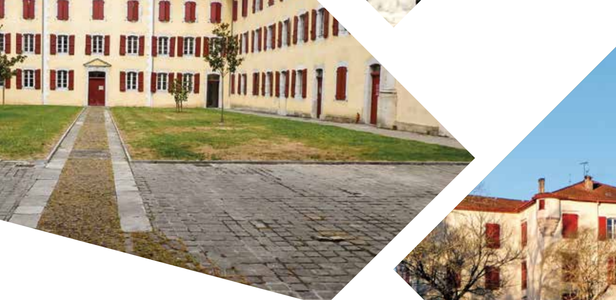
5 Ancienne poste : maison Labourdine qui abrita la première poste au début du XX e siècle.