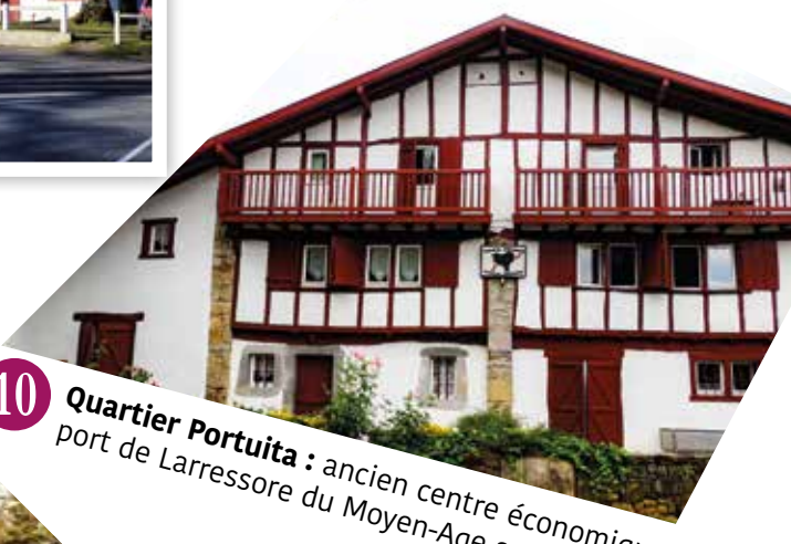
10 Quartier Portuita : ancien centre économique et port de Larressore du Moyen-Âge au XIX e siècle.