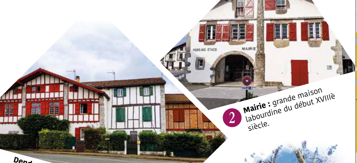
2 Mairie : grande maison labourdine du début XVIII e siècle.