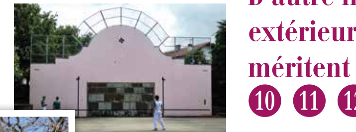
9 Fronton et makhila : ce fronton figurait déjà au cadastre du début du XIX e siècle, et abrite la fabrique de makhila.