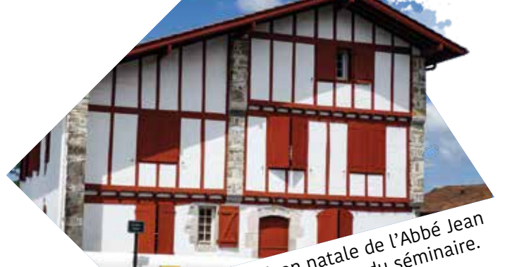
8 Hirigoinia : maison natale de l'Abbé Jean Daguerre (1703), fondateur du séminaire.

en 2005, les bâtiments sont rénovés à l'identique, et abritent une soixantaine d'appartements. La chapelle attenante aux bâtiments, en pure style baroque, est un chef-d'œuvre à voir. Autre élément du patrimoine de Larressore, en dehors de toutes les belles maisons labourdines anciennes, le cimetière militaire au bord de la D 932 renferme entre autres, 131 tombes de soldats morts pour la France pendant la Grande Guerre, et décédés dans l'ancien séminaire transformé à l'époque en hôpital militaire. Larressore compte à ce jour 2090 habitants sur une surface de 10,76 km 2 . Nous y trouvons des zones de prairies, cultures, bois et pacages. La commune fait partie de la zone AOC de production du piment d'Espelette. La fabrique de makhilas, bâtons traditionnels basques est installée sur la commune, et développée par la famille Ainciart Bergara depuis 200 ans. Elle est répertoriée à l'inventaire du patrimoine culturel immatériel de l'Unesco, et labellisée Entreprise du Patrimoine Vivant. Pelerenia : belle maison labourdine, ancien relais sur le chemin de St Jacques de Compostelle.