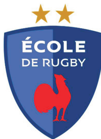
Les U6/U8 d'Inthalatz Larressore

Pour tout adulte qui serait intéressé de venir, intégrer et participer à la vie du club, ou venir encourager nos équipes, ou intégrer l'équipe des joueurs, des entraîneurs ou des bénévoles, merci de prendre contact avec l'un des 2 présidents.