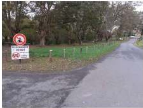
Clôture au pont du diable