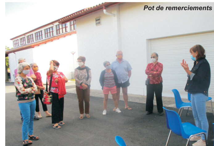
Pot de remerciements

Face à la pénurie de masques, 15 couturières du village ont confectionné bénévolement 1600 masques artisanaux. Nous tenons à les remercier tout particulièrement, ainsi que tous les larressoroar qui nous ont fourni le matériel nécessaire (fil, tissus, élastiques). A ce jour, presque tous ont été distribués.